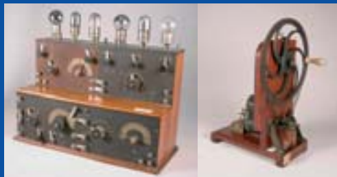
Cabinets scientifiques des lycées impériaux de Périgueux et d'Angoulême